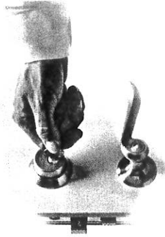
När du kommer hem - Öppna med nyckeln, vredet sätts åter i funktion.